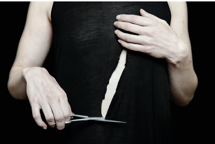
Photographie issue de la série : Territoire fragile