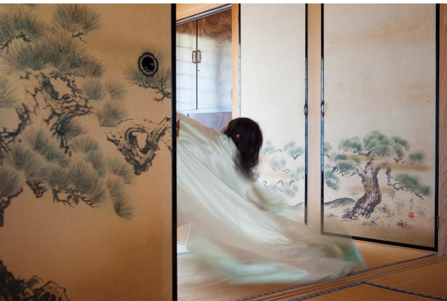
Photographie issue de la série : Homesick