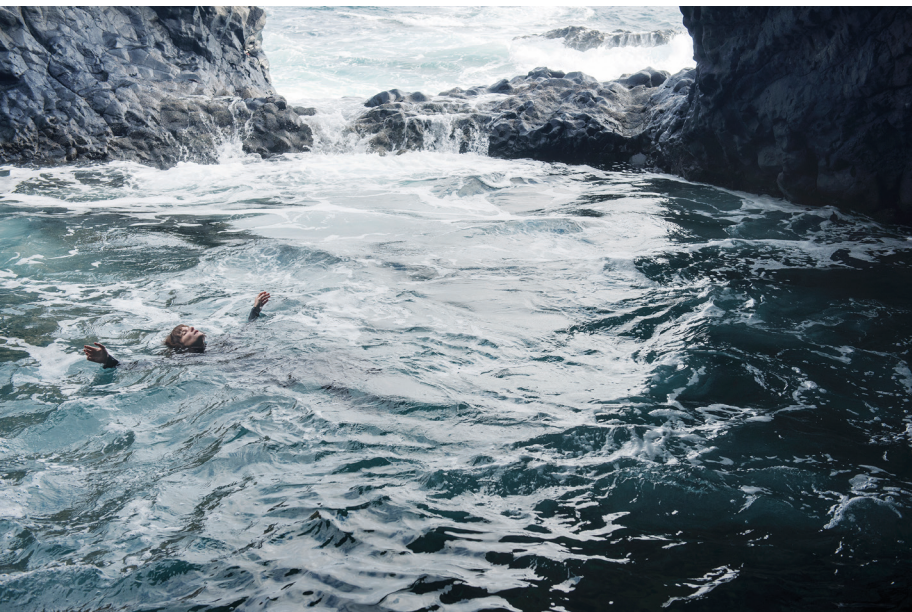
Photographie issue de la série : Motherhood